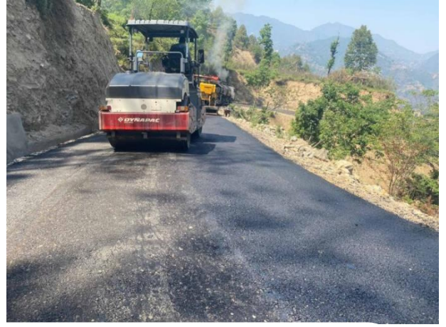
दाप्चा बसेरी सडक कालोपत्रे