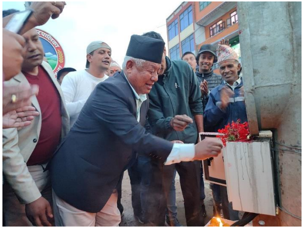
भकुण्डे बजार लक्षित सडक बत्ति