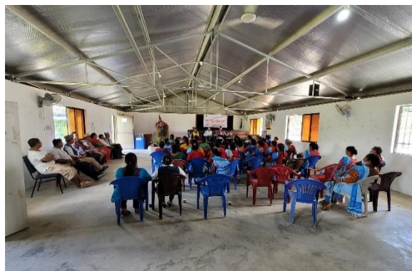
नगरपालिका र रेयुकाई एईको मासुनागा आँखा अस्पताल, बनेपाबीच मोतियाबिन्दु रोगको निशुल्क उपचार गर्ने सम्झौता