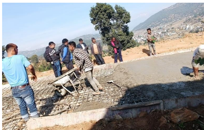
नौबिसे काक्रे सडक