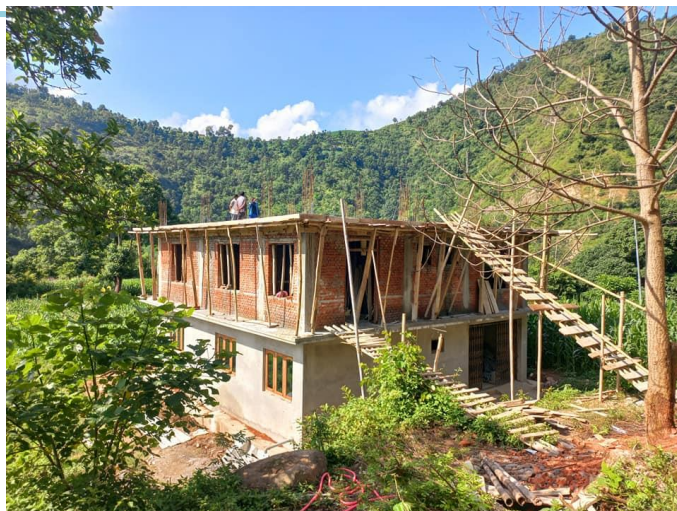
खाक्सी स्वास्थ्य चौकी निर्माण