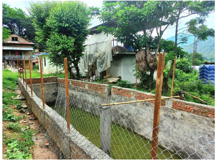
पिपलटार लिफ्ट सिंचाई