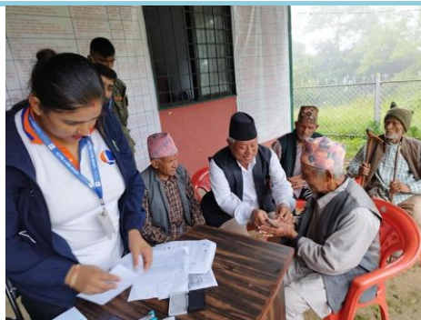
सामाजिक सुरक्षा भत्ता वितरणको लागि स्थानीयस्तर/वडास्तरमा नै घुम्ती बैंकिङ सेवा