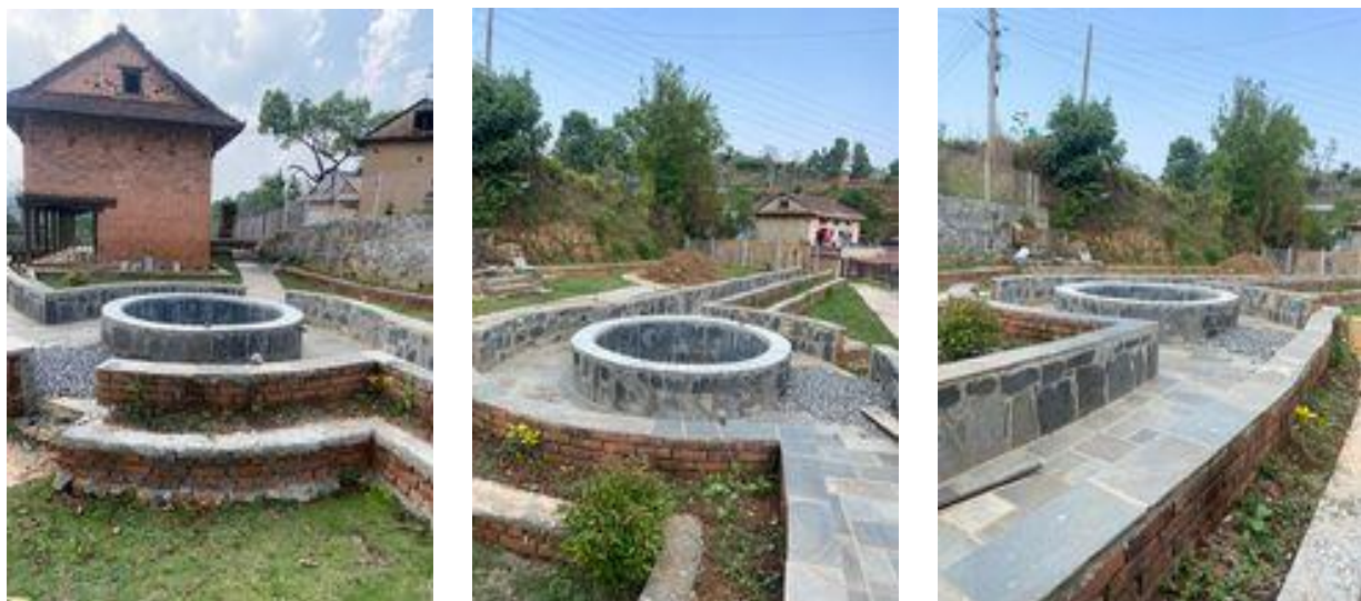
मथुरापाटि पार्क निर्माण