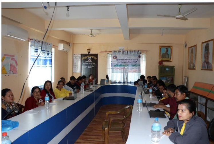
COPOMIS सम्बन्धी तालिम