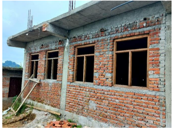
जीवन ज्योति चर्च निर्माण