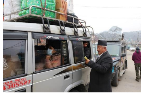
वि.पि. राजमार्ग लक्षित सरसफाई कार्यक्रम