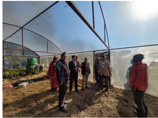
नेपाल नमुना जलवायु अनुकूलन कार्यक्रम