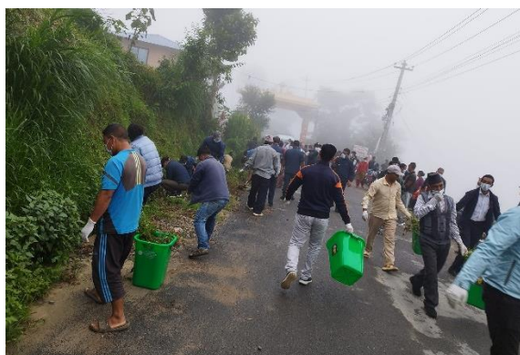
राजमार्ग लक्षित सरसफाई कार्यक्रम