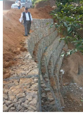
कपुरढुङगा सडक पहिरो नियन्त्रण