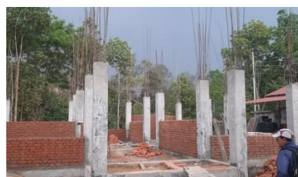
वडा नं १ को प्रशासनिक भवन निर्माण