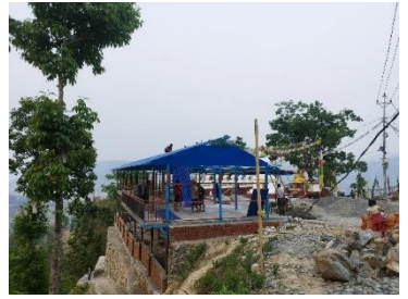
रजबम पोखरी क्षेत्रमा पूर्वाधार विकास