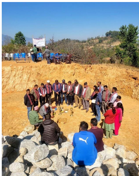
काशीखण्ड वृहत खानेपानी आयोजना