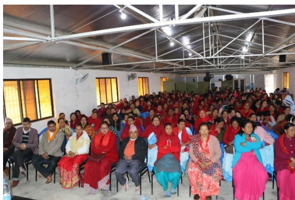
नारी दिवस विशेष कार्यक्रम