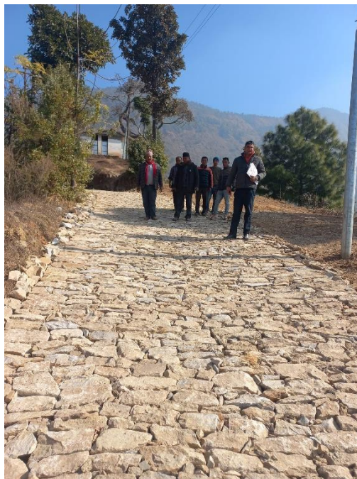
जनजागृति प्रा.वि. हुँदै घ्याडटोल सडक