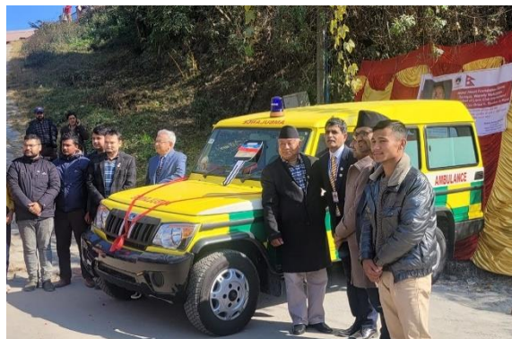
फुलबारी-दाप्चा क्षेत्रलाई लक्षित गरी संचालनमा ल्याईएको एम्बुलेन्स सेवा