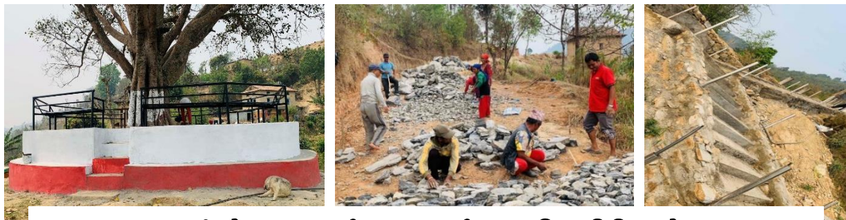
प्रधानमन्त्री रोजगार कार्यक्रम अन्तर्गत सञ्चालित विविध योजनाहरू