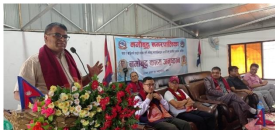
नमोबुद्ध कव्य अनुष्ठान