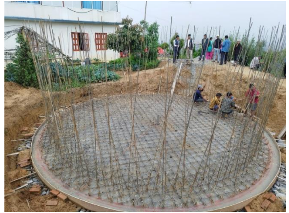
नमोबुद्ध वृहत खानेपानी (ग्वाला डाँडा)को शिलान्यास