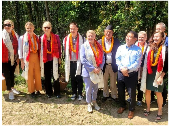
नेपाल जलवायु अनुकूलन नमुना गाउँ कार्यक्रमको अवलोकन गर्न आउनु भएका राष्ट्रिय तथा अन्तर्राष्ट्रिय पाहुनाहरु