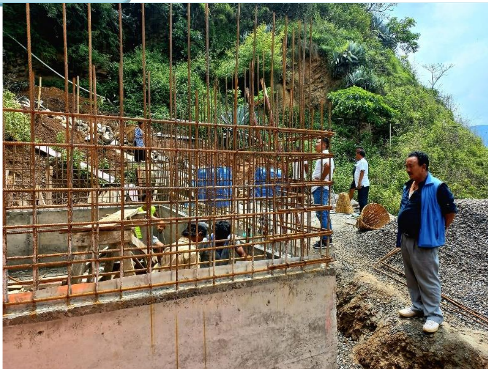
पिपलटार खानेपानी योजना