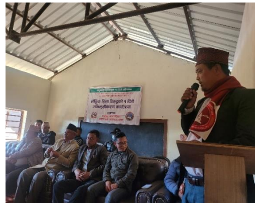
लैंगिक हिंसा विरुद्धको कार्यक्रम