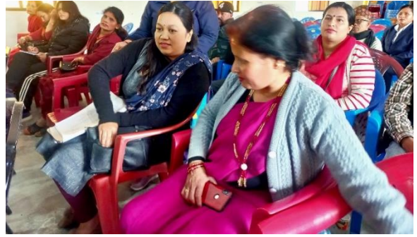
न्यायिक क्षमता अभिवृद्धि तालिम कार्यक्रम