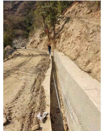
वि.पि. राजमार्ग कानपुर डाँडागाउँ सडक स्तरोन्नती