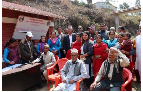
नसर्ने रोगको निशुल्क स्वास्थ्य परिक्षण तथा औषधि वितरण