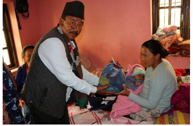
सुत्केरीसँग उपमेयर कार्यक्रम