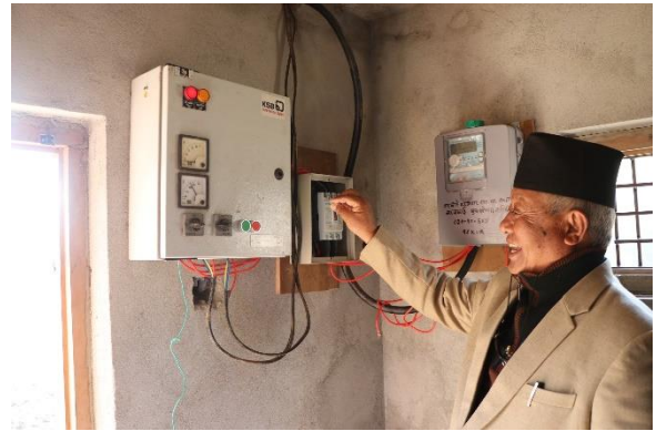
पाकोटे -टटलेटार खानेपानी तथा सरसफाई आयोजना