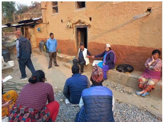
अपाङ्गता परिचयपत्र वितरण