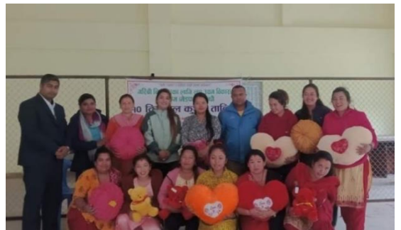
गरीबी निवारणका लागि लघु उद्यम विकास कार्यक्रम