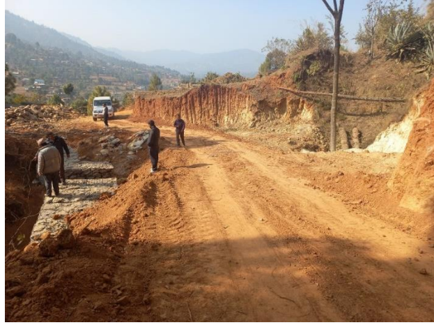
जनक मा.वि. चुवाने सडक