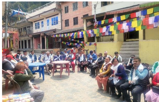
नमोबुद्ध चैत्य परिसरलाई विध्व सम्पदा सुचिकृत गर्नका लागि आवश्यक छलफल