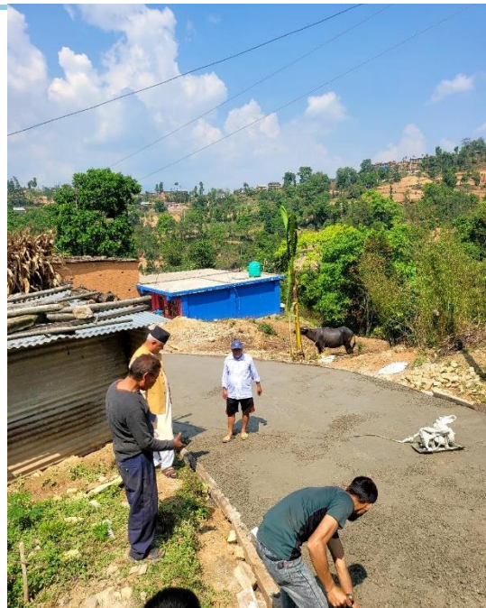
सडक बोर्ड र नगरपालिकाको साझेदारी संचालित बोम्जनगाउँ सडक