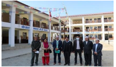
नगर शिक्षा समितिबाट भएको विद्यालय अनुगमन