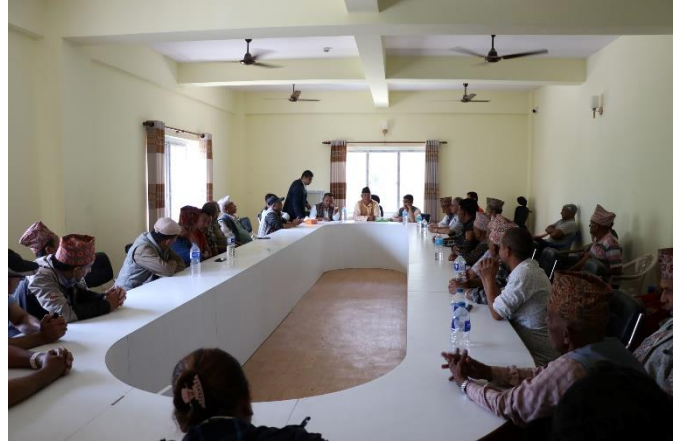
वि.पि. राजमार्ग अन्तर्गत बुच्चाकोट-चौकीडाँडाको रेखांकन सम्बन्धी छलफल