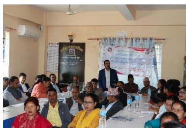
बालमैत्री नगरपालिका घोषणा तयारी अभियान