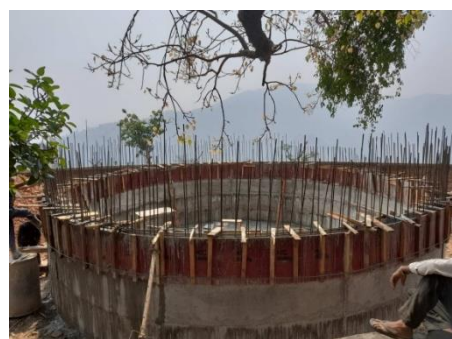
कालिकादेवी भेडाबारी खानेपानी ट्यांकी निर्माण