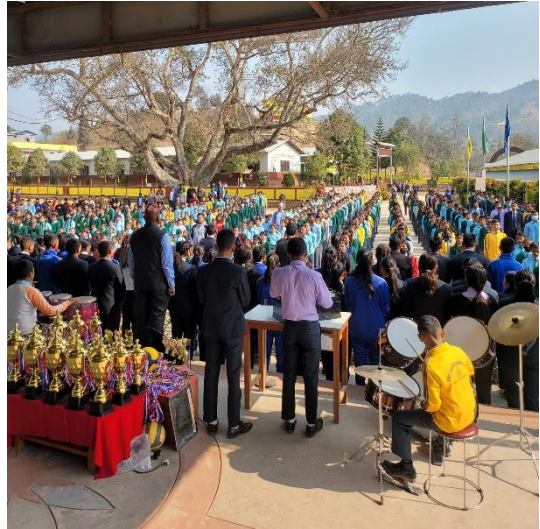
राष्ट्रपति रनिङ्ग शिल्ड