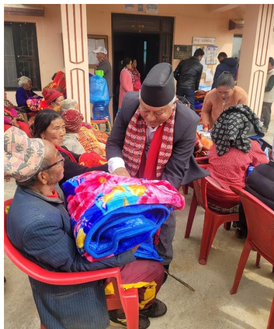
जेष्ठ नागरिक लक्षित कार्यक्रम