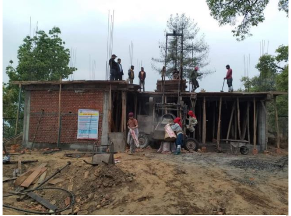
विन्दावासिनी मन्दिर परिसरमा पूर्वाधार निर्माण