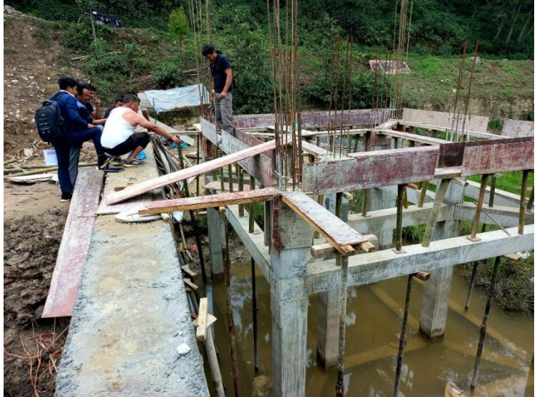
डराउने पोखरी शिव मन्दिर निर्माण