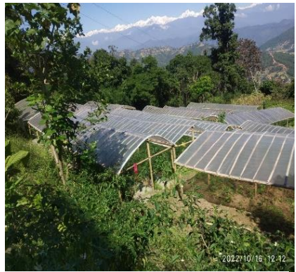
कृषि विकाससँग सम्बन्धित कार्यक्रम