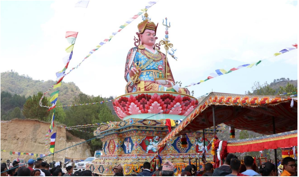
४३ फिट अग्लो गुरु पद्मसम्भवको प्रतिमा निर्माण