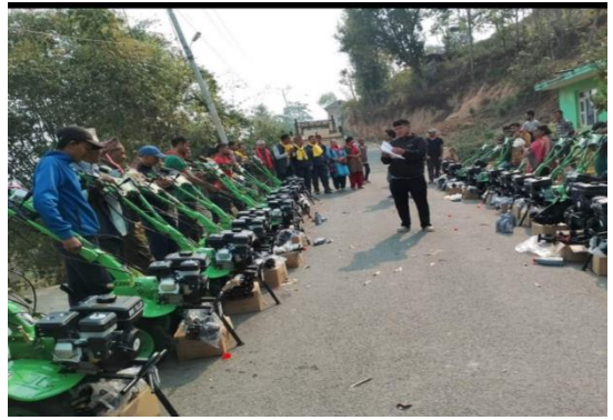
कृषि औजार वितरण